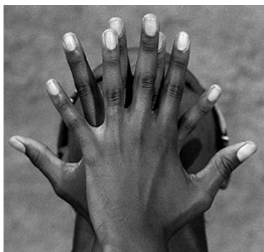
Imagen nº 1 2

La expresión es una de las capacidades que diferencian al ser humano del resto de seres vivos. El lenguaje, la escritura, las formas artísticas..., y también el cuerpo, son los elementos que hacen posible que las personas expresen y manifiesten su forma de ser, de vivir, de sentir y de actuar en el mundo 1 .