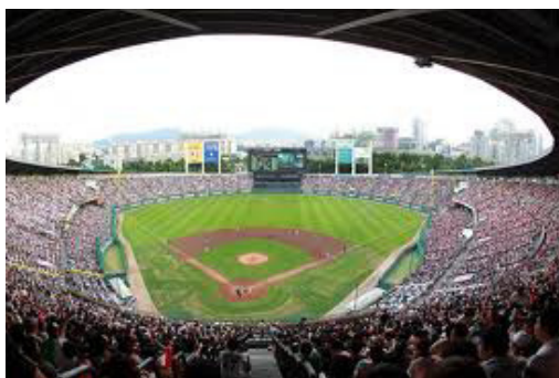
Imagen nº 15 38

Si consideramos la actividad artística y la actividad físico-deportiva como ocupaciones profesionales de la persona, irremediamente, su trabajo será observado y valorado por una serie de espectadores o público, que además estimará la calidad del trabajo realizado según unas normas y variables. En nuestros días estas reglas forman parte del sistema, tanto del arte que precisa de exposiciones, museos y canales expositivos, como del deporte que precisa de patrocinadores, entrenadores, competiciones y recintos. Marty (2000) explica que la Psicología del Arte se aborda desde tres puntos de vista: del autor, del observador y del objeto. Por lo que el observador generalmente se considera dentro del sistema Arte 39 .