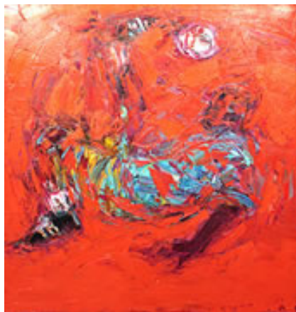
Imagen nº 8 23

Císcar (2008) valora que el componente común en las áreas deportivas y artísticas sea el componente estético, afirmando: “Otra de las similitudes que discurre por ambos terrenos es la componente estética que se alza como protagonista tanto en el arte como en el deporte. Los artistas, actores principales del proceso cultural, son hijos de una estética que cambia en función de la corriente a la que estén adscritos. Los deportistas viven también en esa atmósfera donde la estética es un principio fundamental para coronar laureles victoriosos” 22 ; la misma autora remarca que el arte del siglo XX no se ha distinguido por desarrollar unos valores estéticos asociados al concepto clásico de belleza, observando movimientos artísticos que desarrollaban discursos en el feísmo, por lo que aún así se podría decir que se trata de una estética que genera emociones y sensaciones como lo hace también el deporte.