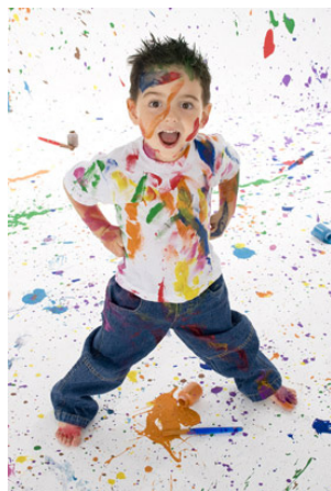
Imagen nº 2 3

El ser humano es expresivo y comunicativo, es pensamiento y acción. A través del cuerpo se relaciona socialmente, puede transmitir cualquier vivencia, cualquier sentimiento, cualquier expresión de sí mismo hacia el exterior. Expresarse es tener algo que decir y decirlo en el lenguaje más significativo, gestos, movimientos, miradas, posturas, dibujos, colores..., es la capacidad de manifestar un deseo, un sentimiento,