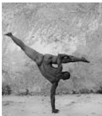
Imágenes nº 11 y nº 12 28