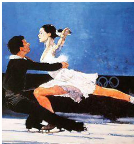
Imagen nº 7 19

Saw 18 en su obra Aesthetics: An Introduction (1971) investigó sobre las obras de arte, clasificándolas en cuatro tipos entre los que está presente el deporte: