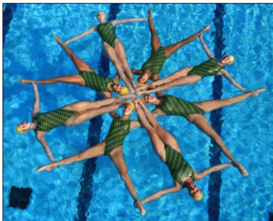
Imagen nº 13 31

Best (1974) y Ziff (1974) comparten esta opinión clasificando los deportes en purpose sports y aesthetic sports es decir deportes con una finalidad (fútbol, baloncesto, rugby, balonmano, hockey, tenis, etc.) y deportes estéticos (ballet, patinaje artístico, saltos de trampolín, natación sincronizada, gimnasia rítmica, esquí, etc.) 29 .