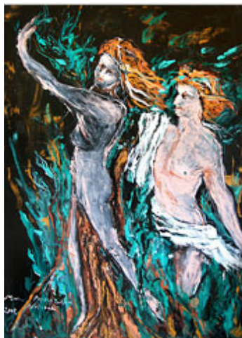
Imagen nº 47

La conexión fundamental entre las actividades física y artística consiste en que ambas se centran en estudio de formas de expresión que el ser humano utiliza para comunicarse.