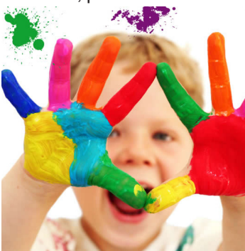
Imagen nº 3 4

El ser humano es expresivo y comunicativo, es pensamiento y acción. A través del cuerpo se relaciona socialmente, puede transmitir cualquier vivencia, cualquier sentimiento, cualquier expresión de sí mismo hacia el exterior. Expresarse es tener algo que decir y decirlo en el lenguaje más significativo, gestos, movimientos, miradas, posturas, dibujos, colores..., es la capacidad de manifestar un deseo, un sentimiento,