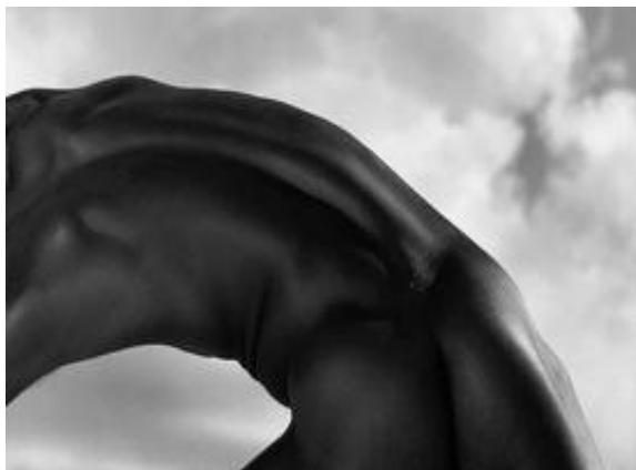
Imagen nº 14 47

En el siglo XX el cuerpo humano continúa siendo uno de los motivos principales de la obra artística al tiempo que sigue atrayendo el interés y manteniéndose como tema en los cuadros, esculturas, fotografías y representaciones que lo muestran. A partir de la década de 1960 adopta un nuevo papel como instrumento para la reivindicación, Aguilar (2008) explica que la aparición de tendencias artísticas como Body Art, Fluxus, Arte Feminista y Accionismo Vie- nés, llevan a que el cuerpo se convierta en protagonista de la producción artística y en un instrumento para la reivindicación social. El cuerpo del artista o el cuerpo de otras personas llega a fundirse con las últimas tecnologías y hacerse presente en el videoarte y el Artnet, lo que nos demuestra la vigencia del cuerpo como referente temático en las representaciones artísticas de todas las épocas.