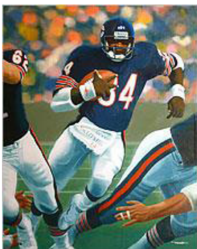
Imagen nº 9 26

Arnaud (1970) considera la actividad físico-deportiva y las artes como diferentes vías de conocimiento que mantienen el aspecto común de la estética, pero manifestada de maneras distintas. Una tendencia en todos los estudios es la de señalar la existencia de dos tipos de deportes o dominios. Para Arnaud el amplio espectro de los deportes contiene en sus extremos los juegos donde se desarrolla una competición contra un oponente y hay fuerte peso competitivo y en el otro extremo del espectro se posicionan deportes como el patinaje y diferentes tipos de gimnasia, donde la mayor importancia estaría en la imagen que se proyecta.