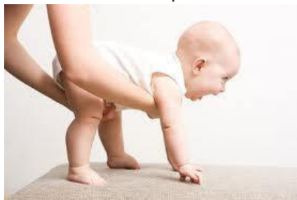
Imagen nº 511

Los fenómenos expresivos han sido estudiados por ramas del saber como la Psicología, la Semiótica, la Sociología y la Historia del Arte, entre otras 9 . Así mismo las formas de expresión artística son la Imagen, la Música, la Danza y la Dramatización.