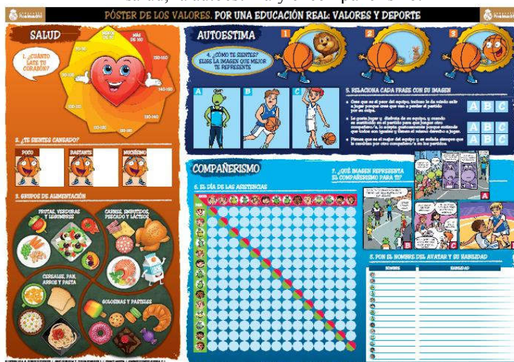
Figura 2. El Póster de los Valores con las actividades para la mejora de la salud, la autoestima y el compañerismo.

Ortega Vila, G. et al (2019). El póster de los valores: recurso didáctico para la educación en valores de los niños y niñas de las escuelas de baloncesto de la Fundación Real Madrid. Revista Española de Educación Física y Deportes , 426 (Esp.), 329-336