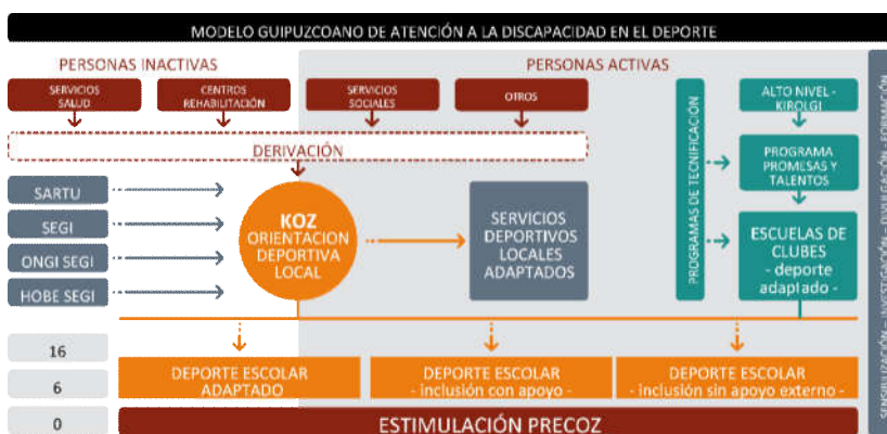
Imagen 3. Modelo guipuzcoano de atención a la discapacidad en el deporte.

de género, y construir una cultura preventiva de comportamientos de homófobos y de violencia de género. (9 proyectos), facilitar la inclusión de las personas con dificultades para la práctica deportiva debido a su diversidad funcional(4 proyectos), facilitar la integración y la acogida de las personas que acuden a Gipuzkoa desde otros territorios o países (4 proyectos), generar oportunidades para el acceso